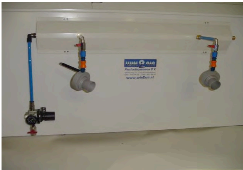
Model de base Airwave Systeme Magnetique

L'ensemble de base se compose d'un panneau d'un mètre avec 2 venturis, un détendeur et un pointeur laser. Cette ensemble est facilement extensible en reliant plusieurs panneaux ensemble.